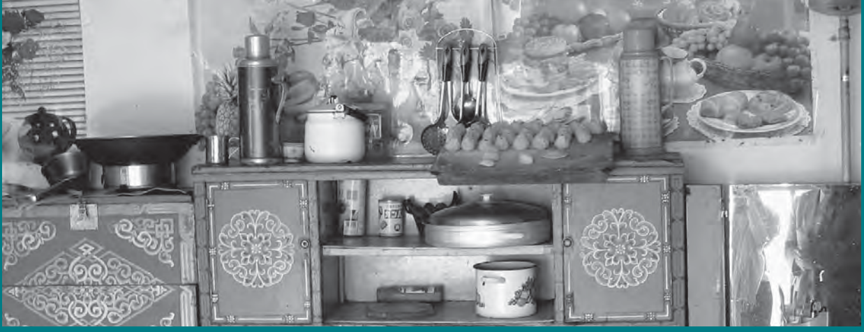
चित्र: युएन एस्कैप

एशिया एवं प्रशांतीय क्षेत्र में तीव्र शहरीकरण एवं आर्थिक वृद्धि के दबाव से शहरी गरीबों को अपने आवासीय इलाकों से निष्कासित किया जा रहा है। अधिकांश मामलों में इनका पुनर्वास रोजगार एवं आर्थिक अवसरों से दूर परिधीय क्षेत्र में किया जाता है। साथ ही, 50 करोड़ से अधिक लोग फिलहाल एशिया एवं प्रशांतीय क्षेत्र की स्लम या और अनाधिकृत बस्तियों रह रहे हैं और यह संख्या बढ़ रही है।